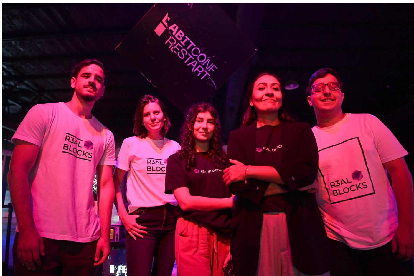
El #R3alTeam se reunió en LABITCONF

La inestabilidad económica y la exclusión financiera son problemas establecidos en la mayoría de los países Latinoamericanos, que impacta en la posibilidad de ahorro de las personas y el financiamiento de las PyMEs. De la incertidumbre de no saber si uno puede comprarse una casa propia o un auto, R3al Blocks se crea en busca del acceso a la propiedad y a la inversión.