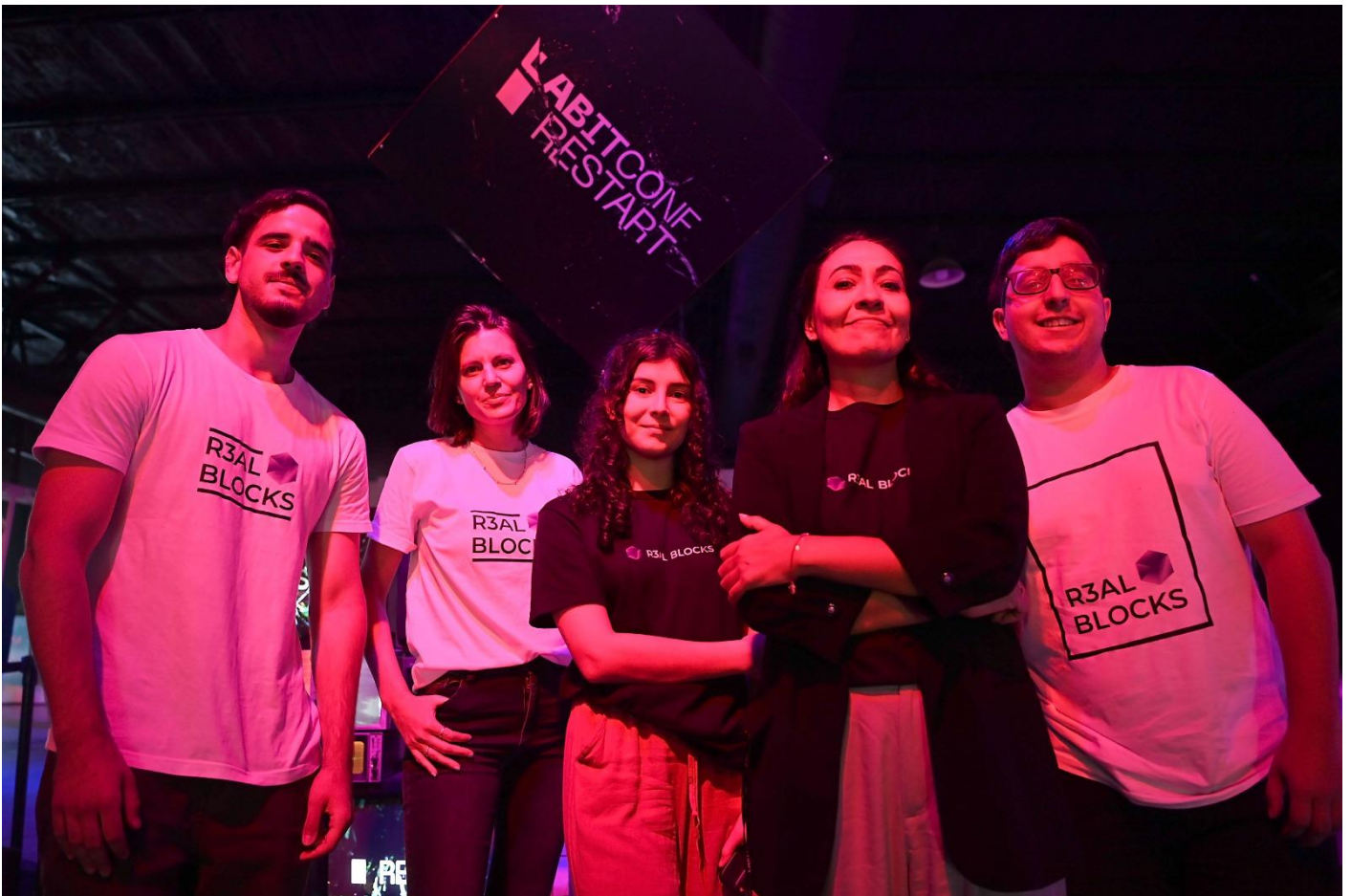
El #R3alTeam se reunió en LABITCONF

La inestabilidad económica y la exclusión financiera son problemas establecidos en la mayoría de los países Latinoamericanos, que impacta en la posibilidad de ahorro de las personas y el financiamiento de las PyMEs. De la incertidumbre de no saber si uno puede comprarse una casa propia o un auto, R3al Blocks se crea en busca del acceso a la propiedad y a la inversión.